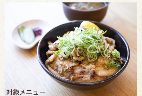
対象メニュー うちうらレモン塩糍の豚丼 1000円(税込)

城山公園の近くにある6次産業施設。対象メニュー「うちうらレモン塩糍の豚丼」で締めくくろう。