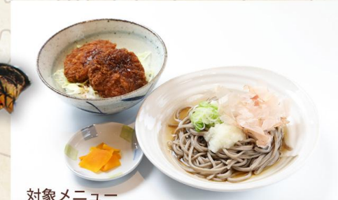
対象メニュー ミニかつ丼セットおろし(冷) 1300円(税込)

物販エリア等があるエンターテイメント型道の駅。北陸自動車道「南条サービスエリア」から徒歩での往来が可能。「そば処いまじょう」で対象メニューも食べてみよう。