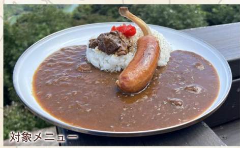
対象メニュー ソーセージカレー 1800円(税込)

三方五湖の絶景を通る県道三方五湖レインボーライン線の途中にある公園。併設のレストラン&カフェ「レインボー」でソーセージカレーを食べてオリジナルステッカーをGETしよう！